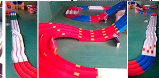
※当店サーキットイメージ。当日のレイアウトとは異なります。