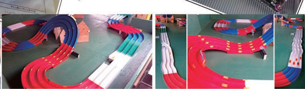
※当店サーキットイメージ。当日のレイアウトとは異なります。